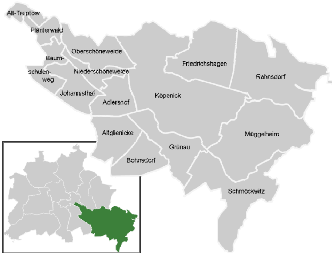
Abbildung 2: Treptow-Köpenick 217

Mit einer Fläche von 16.841 Hektar handelt es sich bei dem im Süden gelegenen Treptow-Köpenick um den größten unter den Berliner Bezirken.